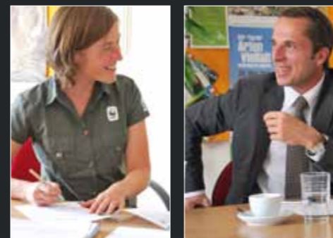
Feu vert pour le Printy Original 4.0 du WWF.

vert. L'Original Trodat Printy 4.0 est incroyablement petit, étonnamment léger et fabriqué jusqu'à 65%* en plastique recyclé. Ainsi, il épargne des ressources précieuses et réduit son empreinte écologique. Les émissions de CO 2 inévitables sont compensées par des projets de protection de l'environnement Gold Standard. Qu'en pensez-vous ?